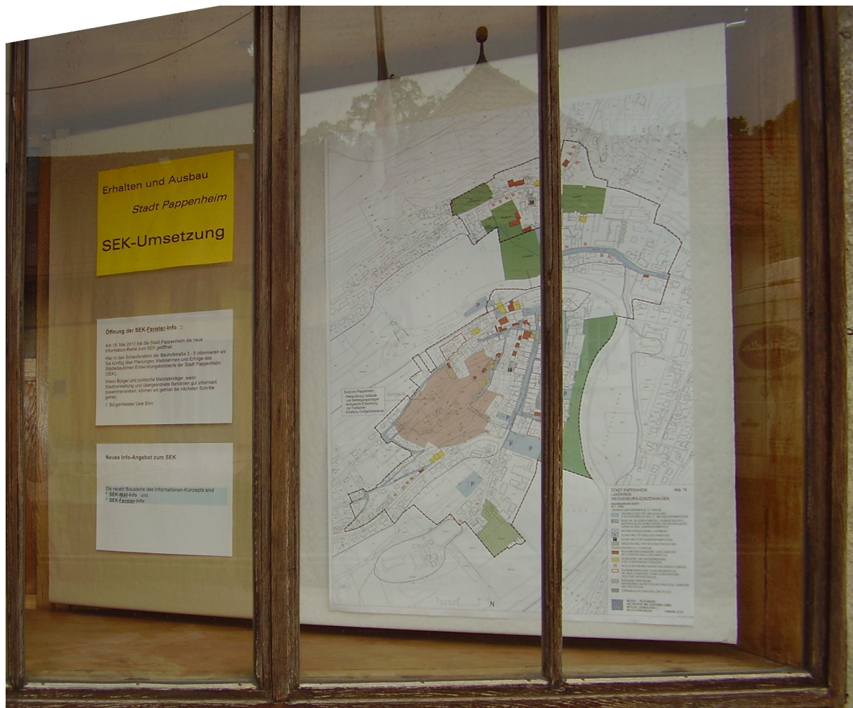
< 2011 > SEK-Info; Bauhof 3-5; hms;3,3.1 B3-Info-F2-1b,1c-2011-07-22-01.JPG

Weiterführung :: empfohlene hohe Priorität.