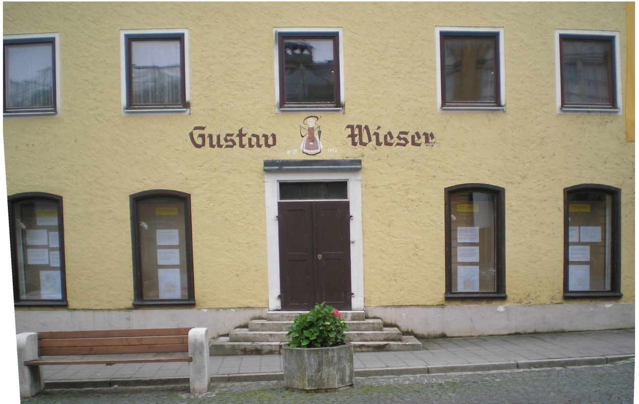
< 2010 > D1-Info :: LI630.D1-hms-D1.Info.4-20100723-05-aus.JPG