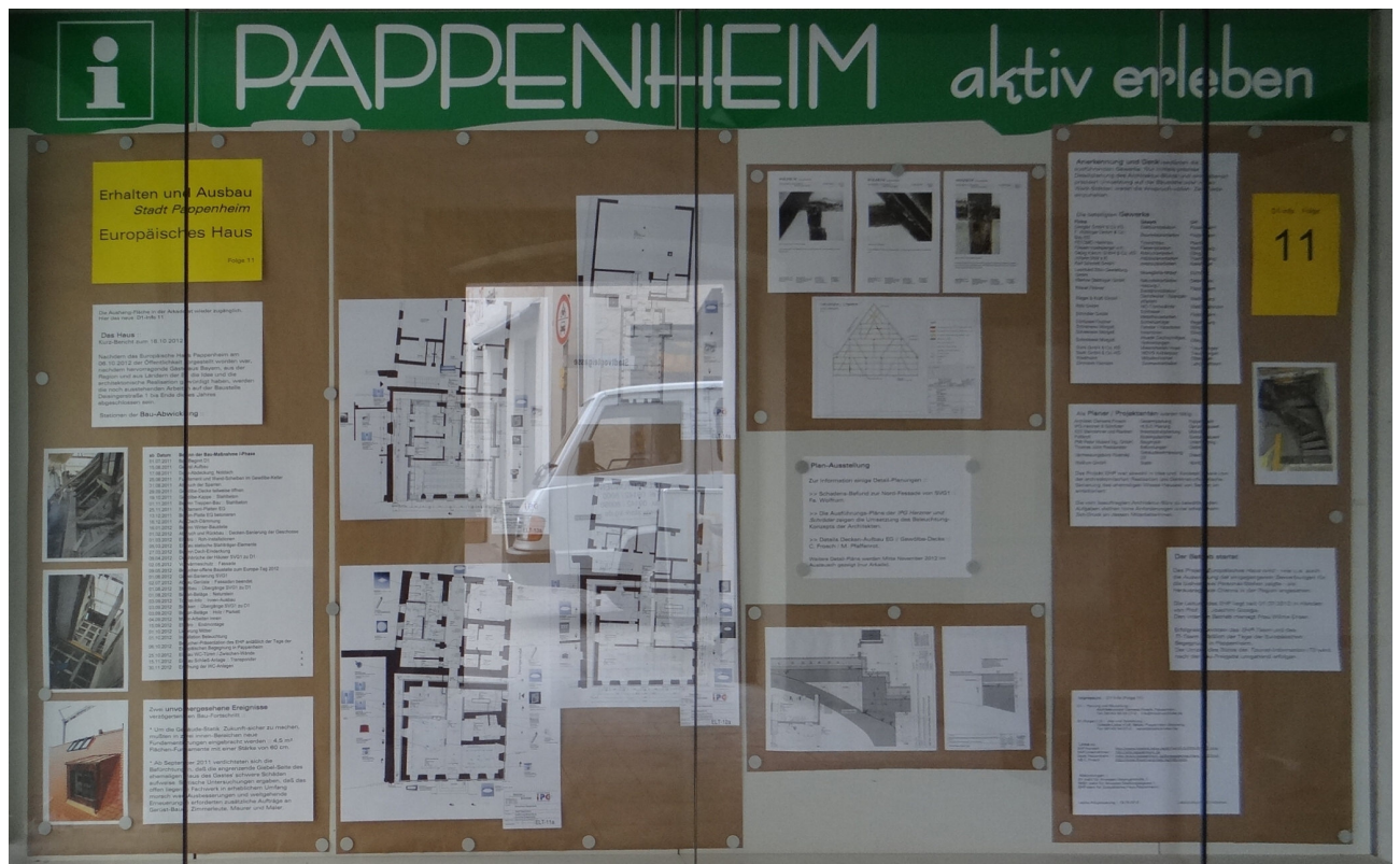
< 2012 > D1-Info :: hms;2012-10-23;715-aus-para-3x.jpg